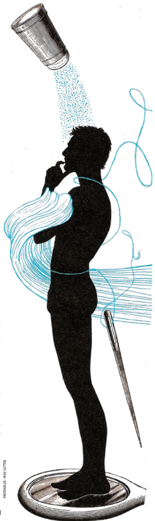
PHOTOILLUSTRATION: INGE LUTTNER

Pflicht, 150 Euro müssen Sie dafür rechnen. Braune Schuhe gehen nur zum braunen oder blauen Anzug; der Gürtel sollte dieselbe Farbe haben wie die Schuhe. Auf www.blacksocks.ch können Sie sich jeden Monat neue Socken schicken lassen. Noch besser als die sind aber lange Strümpfe.